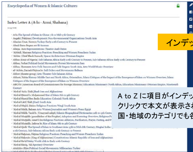
インデックス表示画面

出版物内での検索ができます。引用機能やメール送信、FacebookやTwitter、Mendeleyとの連携、もちろん印刷も可能です