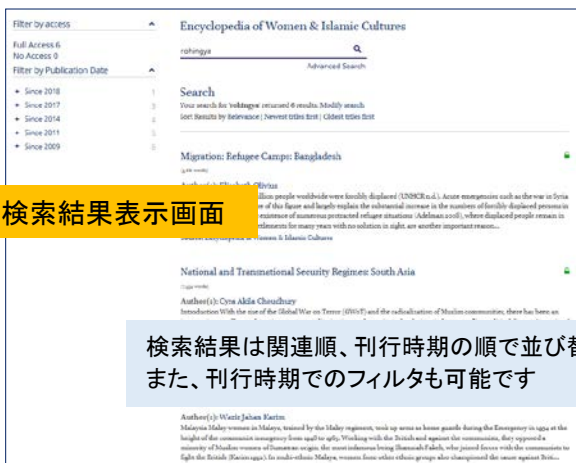
検索結果表示画面

検索結果は関連順、刊行時期の順で並び替えができます。また、刊行時期でのフィルタも可能です