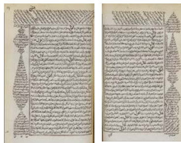
'ABD al-WAḤḤĀB ibn IBRĀHĪM ('Izz al-Dīn) al-Zanjānī. Beḡin . الحمد لله رب العالمين. [Al-Mabādi fil-taṣīr, commonly called al-'Izzī. A short treatise on the inflexion of the verb in Arabic.] See AḤMAD ibn 'Alī ibn Mas'ūd. هذا مجموع الـ