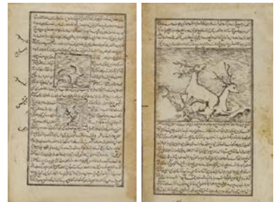
— هذا هو الكتاب المعروف بالتصرف [Another edition, with marginal annotations.] See JĀMI' al-MUKADDIMĀT. (جامع المقدمات.) 4. [1884.] 8°. 14594. a. 25.

Early Arabic Printed Books Online は年間管理費不要です 収録内容等、詳細は弊社までお申し付けください