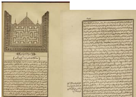
'ABD al-RAḤMĀN ibn ḤASAN, al-Jabartī . التاريخ. [A]ḥqā'ib al-asmā' ʿibn al-athār. A history of Egypt from the commencement of the twelfth century of the Hijrah down to a.H. 1236. 4. vol. 121 v. [Bulak, 1880.] 4°. 14554. c. 6.