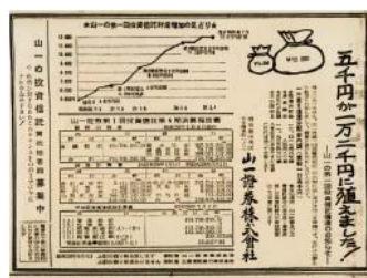
昭和28年 投資信託新聞広告