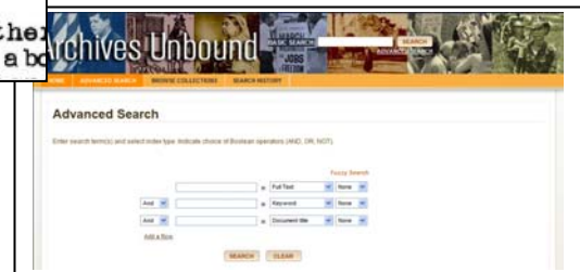
◆Basic Search および Advance Search 機能◆