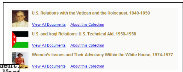
◆購入コレクションごとのブラウザ画面◆