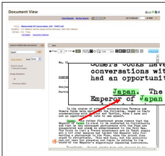
◆検索用語はハイライトされます◆